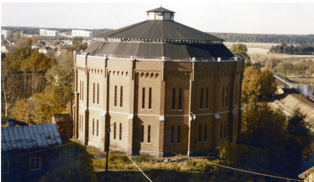
Även vissa rivna byggnader kan komma att uppmärksammas med skyltar i framtiden. T ex Gasklockan på Kvarnberget som uppfördes 1906 bl a för att bygga ut gatubelysningsnätet och revs 1968.