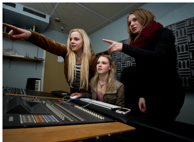
Engagerade deltagare vid kurs i inspelningsteknik i SpeedBall Studio på Gjuteriet.

Rockmusikverksamheten i Studieförbundet regi var omfattande och innebar maximalt utnyttjande av lokalerna. Vid årets utgång samutnyttjade 30 musikgrupper (med ca 150 medlemmar) nio ljudisolerade repetitionsrum och SpeedBalls inspelningsstudio som också användes av tillfälliga nyttjare. Studioen var i princip fullbokad under året och en rad inspelningar genomfördes. Även flera kurser i inspelningsteknik hölls. I provisoriska lokaler i källarplanet samsades också tre musikgrupper och den mindre studioen Musiksmidjan i källaren utnyttjades för inspelningar.