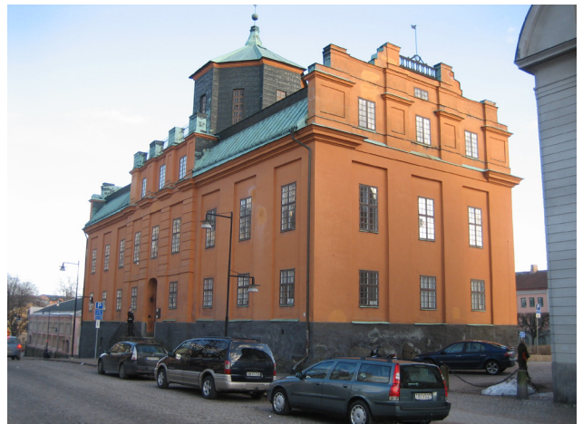
Gamla gymnasiet med sin karaktäristiska lanternin invigdes 1759. Byggnaden fungerade som skola och kallades Gymnasium Adolphus Fredricianum efter kung Adolf Fredrik som då var Sveriges regent. Det är en av Karlstads äldsta byggnader och sedan 1935 skyddat som statligt byggnadsminne.