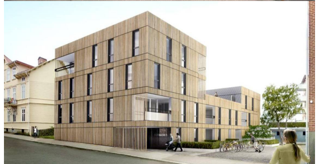
Gröna villan på Olovsgatan 5 som är det äldsta bevarade huset i kvarteret och kulturhistoriskt värdefullt överst skall nu rivas för att ge plats åt ett bostadshus med 19 lägenheter ovan.

den att en detaljplaneändring skall påbörjas. Ärendet fick stort utrymme i media och föreningen uppmärksammade rivningsplanerna via sin facebook-sida. En ny detaljplan fastställdes i maj 2016 och Stadsbyggnadsnämnden beviljade rivningslov med motiveringen att behovet av 19 nya lägenheter i ett attraktivt läge väger tyngre än husets kulturhistoriska värde. Föreningen kan återigen konstatera att utpekade kulturhistoriska värden i kommunens egna Kulturmiljöprogram inte innebär något skydd mot rivningar.