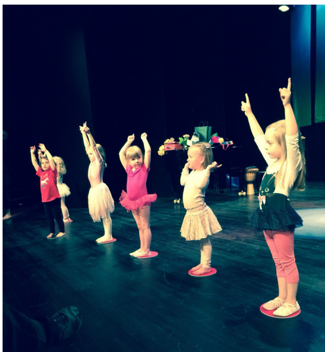
Barnen från Kulturverkstans pyttedansgrupp visade upp sina färdigheter vid terminsavslutningen på Arenan

I Sensus Barnmusikskola deltog under 2016 nära 200 barn i åldrarna 0-14 år varje vecka i 23 grupper med inriktning på musikal, dans, musik & rörelse och musik samt tre föräldra/barngrupper för de allra minsta. En ny aktivitet för året var också en musikalgrupp för seniorer som träffades en gång i veckan. Lokalerna nyttjades även regelbundet av Nyeds Dragspelsklubb och en grupp som utövade balans- och rörelseträning. Barnmusikskolan anordnade även ett sommarläger i juni för 30 barn i åldern 10-12 år.